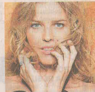
Eva Herzigová Obchodník s módou Rittig vozil na přehlídky slavné modelky.