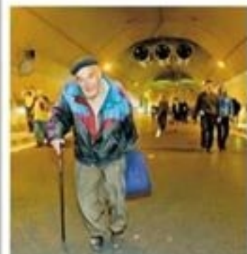
Chodí tam už byli Na podzim se tunelem prošli lidé.

Loni cyklisté při Velké jarní cyklojízde vyrazili na trať v sobotu. Vyjeli od kostela na náměstí Jiřího z Poděbrad a přes centrum města se dostali do Stromovky. Při průjezdu tisíců cyklistů policisté postupně uzavírali dopravu, podobná omezení budou i letos. (ČTK)