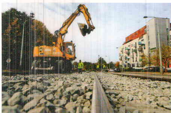
REKONSTRUKCE POD LUPOU. Policie vyšetřovala v dopravním podniku účelové rozdělování zakázek na rekonstrukce tramvajových tratí. Detektivové, kteří pracovali s verzí spolčení advokátů s vedením podniku a stavebními firmami, nedokázali trestný čin a případ odložili.