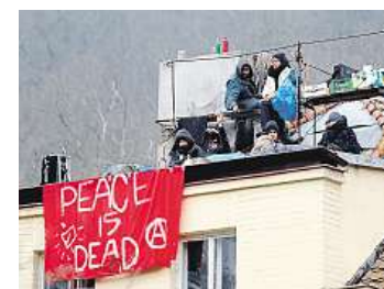
Obsazení Squateři upozornili na problém usedlosti.

Změny územního plánu schvaluje pražské zastupitelstvo. Podle Koláře jsou za průtahy zodpovědní magistrátní Zelení, s tím ale nesouhlasí opoziční zastupitel Prahy 6 Ivan Hruza (KSČM). Tvrdí, že se mohlo změny dosáhnout už dříve, kdyby radnice lobbowała na magis-