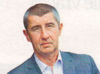
ANDREJ BABIŠ Třetí nejbohatší Čech, majitel skupiny Agrofert, založil politické hnutí ANO 2011 pod heslem boje s korupcí.