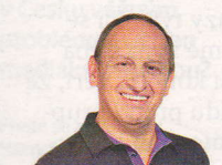
JAN KRAUS Populární herec a moderátor je dnes patrně nejangažovanějším umělcem, který po boku byznysmenů bojuje s korupcí. Kauzu Dopravní podnik glosoval ve své show na TV Prima.

korupci musí čelit. V pražských podnikatelských kruzích se lze například setkat se spekulacemi o jeho údajném napojení na některé příslušníky české justice. Konkrétně na prezidentku Unie státní zástupců Lenku Bradáčovou.